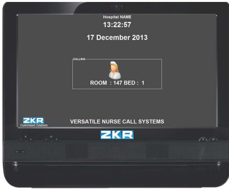
Versatile Hemşire Çağrı Paneli

Herhangi bir Unix veya Windows tabanlı bilgisayara yüklenebilir, rahat ve modern hemşire istasyon yazılımı; kullanıcı dostu arayüzü ile oda ve yatak hastaları görüntülenebilir. Sistem yapılan çağrıların önceliğine göre ekrana doğru bir şekilde yansıtır. Tüm çağrılar, acil yardım çağrıları, wc çağrıları ve hemşire girişleri panelden takip edilebilir.